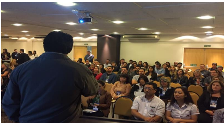
Abertura do evento