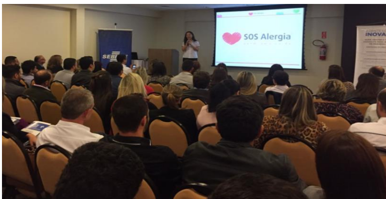
Depoimento da finalista do Prêmio Nacional de Inovação