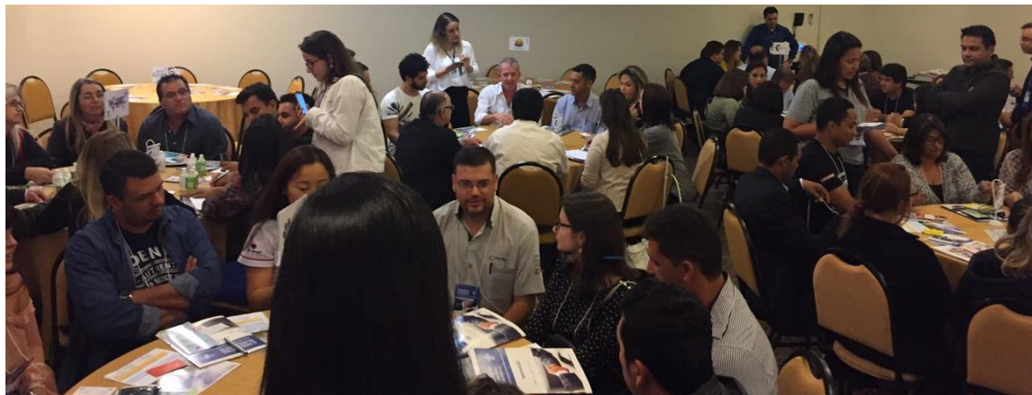
Rodada de integração