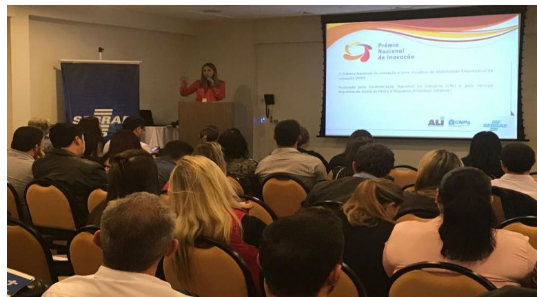
Palestra sobre o Prêmio Nacional de Inovação