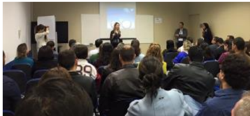
Palestra: Como inovar com parcerias estratégicas