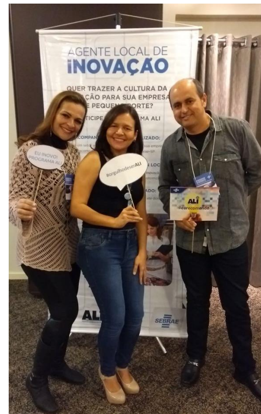
Integração dos agentes e empresários