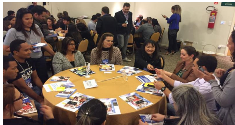
Rodada de integração