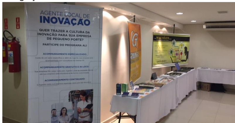
Área de exposição das empresas