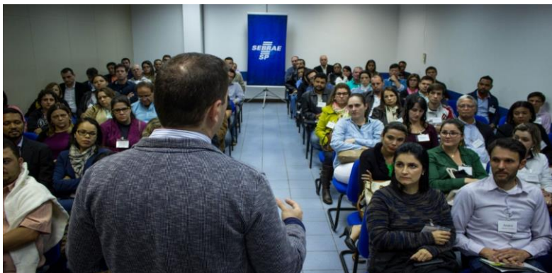
Abertura do evento