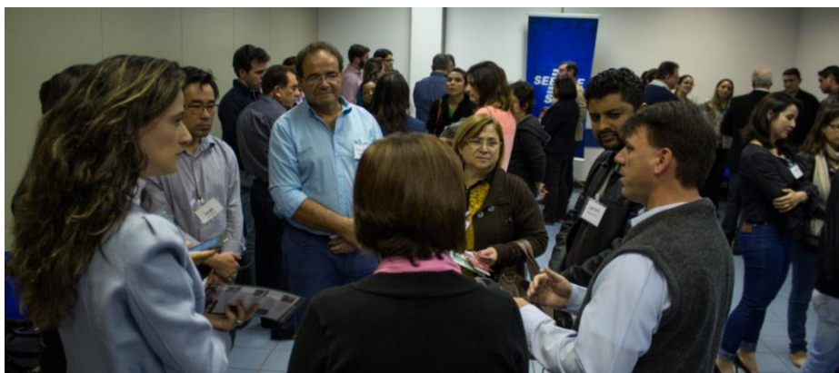
Rodada de integração e parcerias